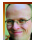
Tekst og foto: Lars Brevanger, Freelance-journalist

- Jeg husker det var et enormt antall fabrikkpiper over alt i byen, sier han.