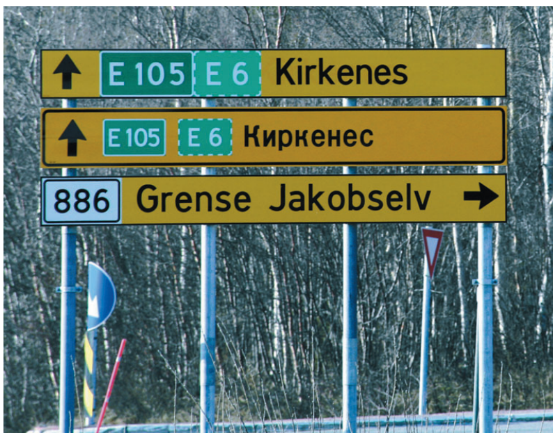
Ved grensestasjonen på Storskog.