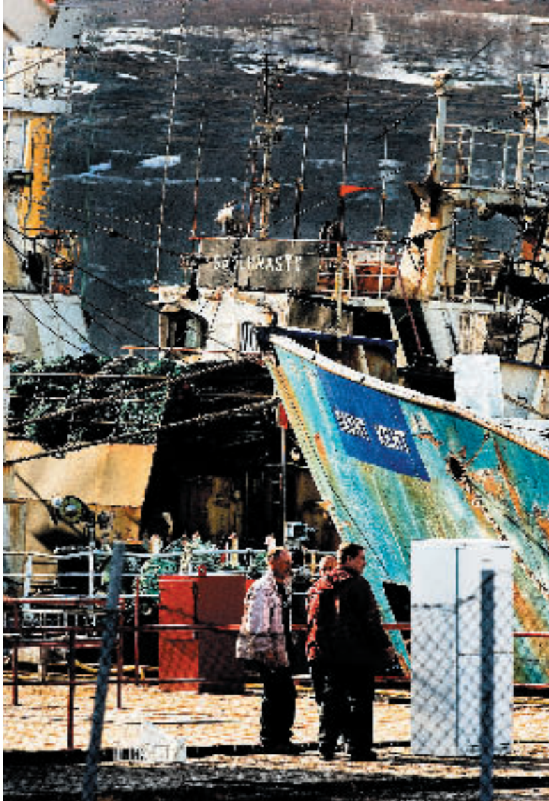
Russiske kongekrabbefartøy i dokk ved KIMEK

Russiske redere står for 80 prosent av omsetningen ved KIMEK. I dokken ligger russiske fisketrålere på rekke og rad, 25-30 fartøyer, med mannskap om bord. I løpet av året kan 7-800 russiske trålere ha ligget i havn her. Noen ligger i dokk i flere måneder av gangen, med sjøfolk om bord som driver forefallent vedlikehold, uten penger til å gjøre byen uttrygg, og med ruslutter i gatene, Sjømannsklubben eller biblioteket som eneste fritidstilbud utenfor skipet. Men det er ikke noe bråk, forteller Greger Mannsverk.