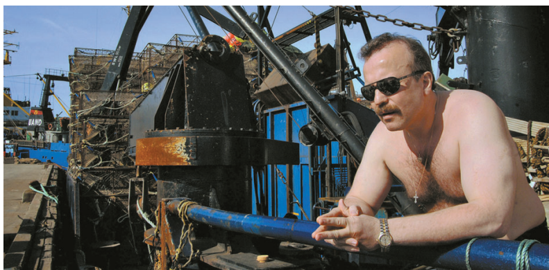
Kapteinen har kastet skjorta i det fine været. Her kan båten ligge til kai i flere måneder av gangen. (John Hughes)

Han er businessmann og synes ikke det er vanskeligere å