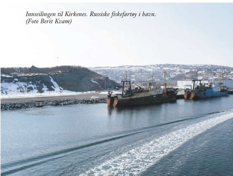
Innseilingen til Kirkenes. Russiske fiskefartøy i havn.

Sjøfolk på vei hjem til Murmansk. I løpet av de siste 10 åra har over 100 000 sjøfolk mønstret av og på over Kirkens havn