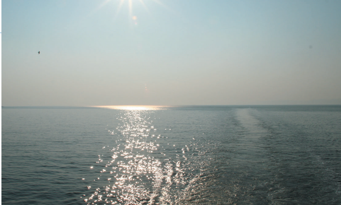
Barentshavet, gjemmer kanskje verdens største energirikdommer til havs.