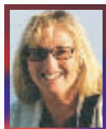
Av: Berit Kvam